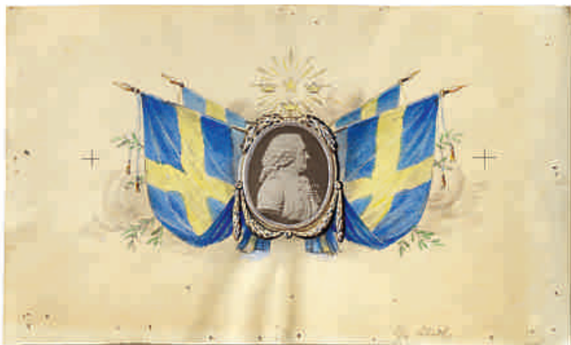
ORIGINALET TILL DEN VINJETT BILD som användes i inbjudningarna till Akademiens Linnéfest 1907.